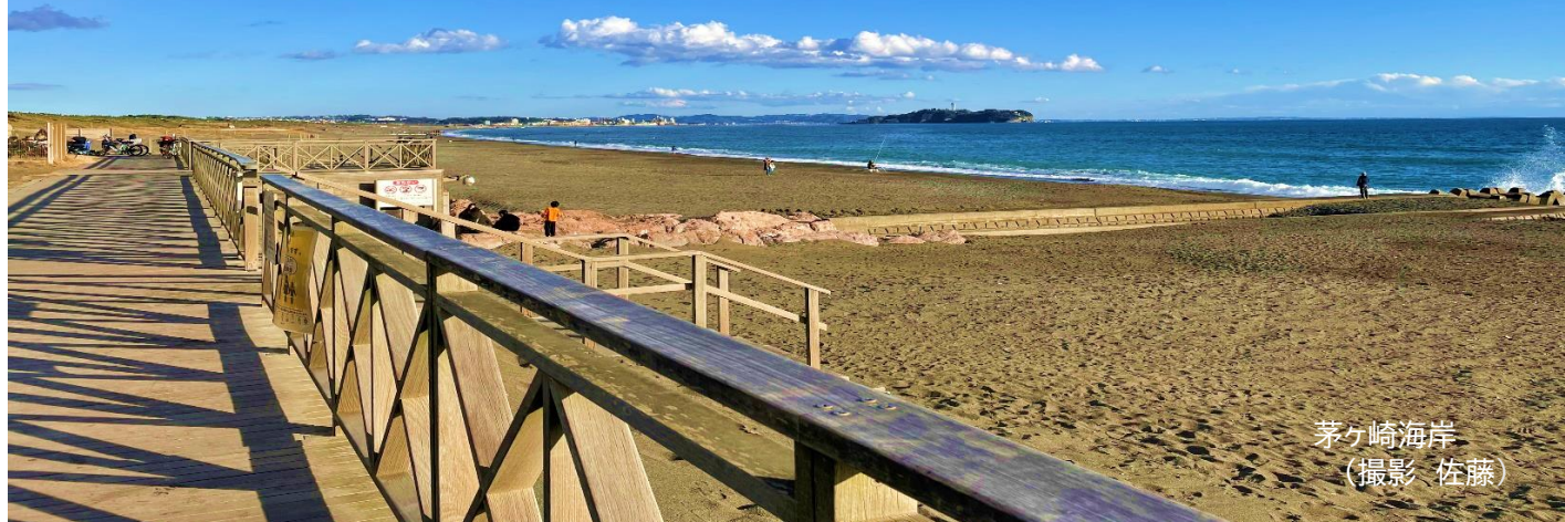
茅ヶ崎海岸