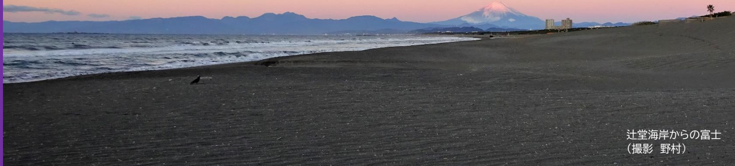
辻堂海岸からの富士