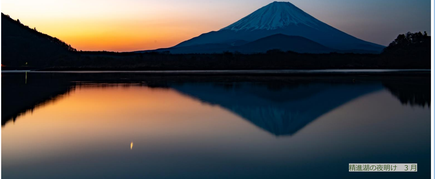
精進湖の夜明け 3月