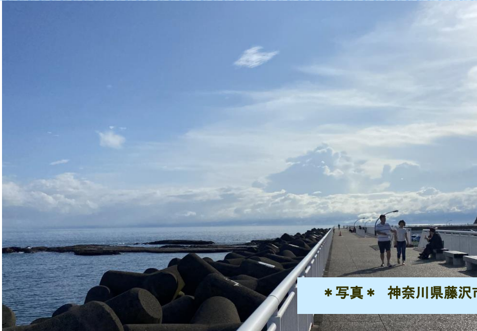
* 写真 * 神奈川県藤沢市 湘南 江ノ島