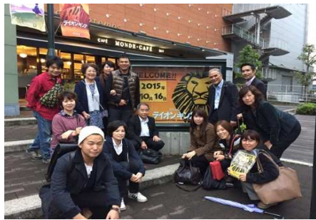
< 鑑賞後に劇場で集合写真を >

ライオンキングを鑑賞後、もつ鍋『やまや』さんで夕食を頂きました。こちらのお店は福岡の博多にある辛子明太子を製造している会社のお店であり、随所に料理の中に辛子明太子が使われていて、とても美味しかったです。こちら是非ともお勧めしたいお店です！！