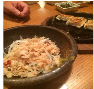
< 『やまや』さんの餃子 >